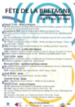
Le programme en français