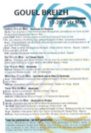
Le programme en breton

En association avec KLT, nous aurons droit à la traduction des noms bretons des rues et quartiers traversés et quelques éléments du vélo en breton.